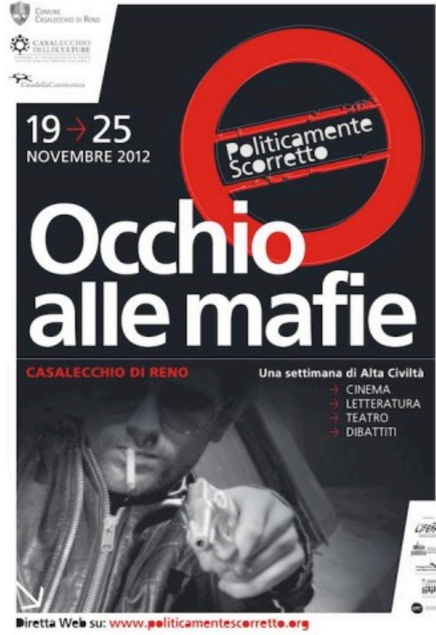
Locandina, "Occhio alle mafie"

TOPICS: Carlo Lucarelli, cinema, giustizia, legalità, Libera, lotta alle mafie, Politicamente Scorretto