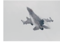
L'aeronautica militare in Romagna