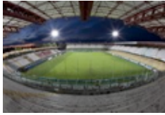
Le pagelle del Cesena le fai tu