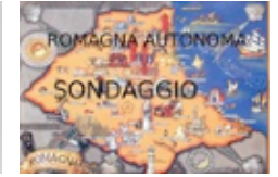
Romagna autonoma dall'Emilia