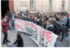
Bandiere, striscioni e studenti