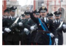
La Romagna celebra il 4 novembre